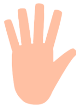
て te hand, arm