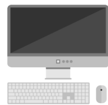
パソコン pasokon personal computer