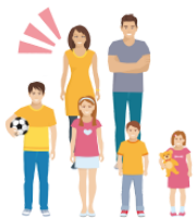
おかあさん okāsan someone else's mother