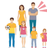
おとうさん otōsan someone else's father