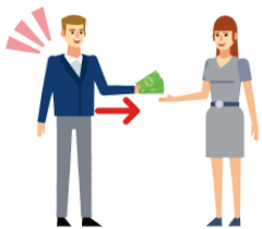
かします kashimasu lend