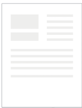
かみ kami paper