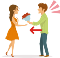
あげます agemasu give