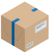
にもつ nimotsu baggage, parcel