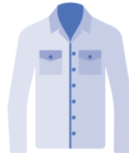
シャツ shatsu shirt