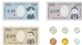
おかね okane money