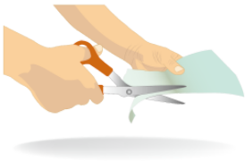
きります kirimasu cut, slice