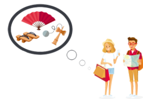
(お)みやげ (o)miyage souvenir, present