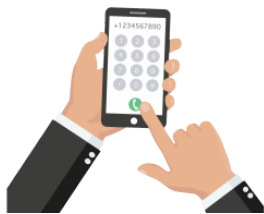
かけます [でんわを] kakemasu(denwawo) make (a phone call)