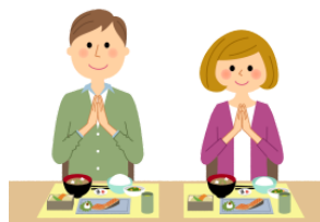
いただきます。 itadakimasu. Thank you. (before eat/drink)