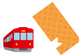
きっぷ kippu ticket