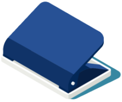
パンチ panchi punch