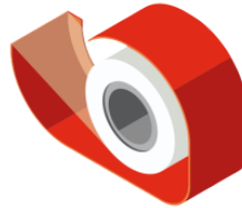
セロテープ serotēpu scotch tape