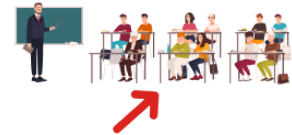
ならいます naraimasu learn