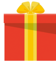
プレゼント purezento present, gift