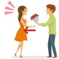
もらいます moraimasu receive