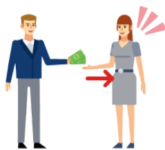
かります karimasu borrow