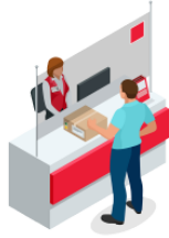
おくります okurimasu send