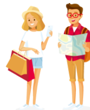
りょこう ryokō trip, tour