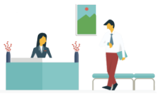
うけつけ uketsuke reception