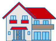
うち uchi house, home