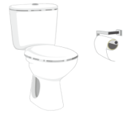
トイレ toire toilet