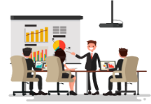
かいぎしつ kaigishitsu meeting room