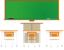
きょうしつ kyōshitsu classroom