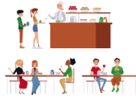
しょくどう shokudō canteen