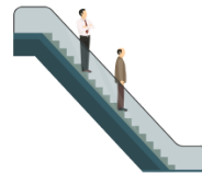
エスカレーター esukarētā escalator